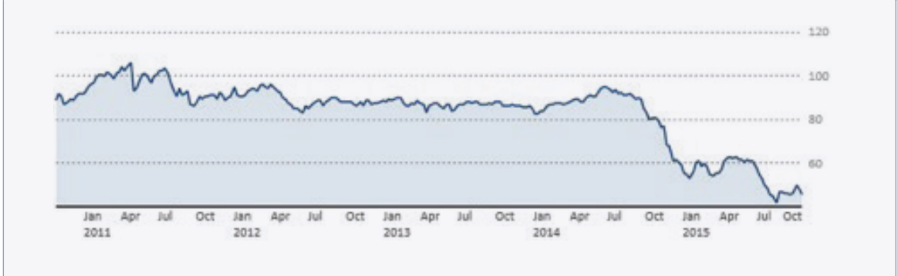
GRAFİK 1. HAM PETROL FİYATINDAKİ DEĞİŞİM (2011-2015)

Kaynak: CNBC, http://data.cnbc.com/quotes/%40CL.1