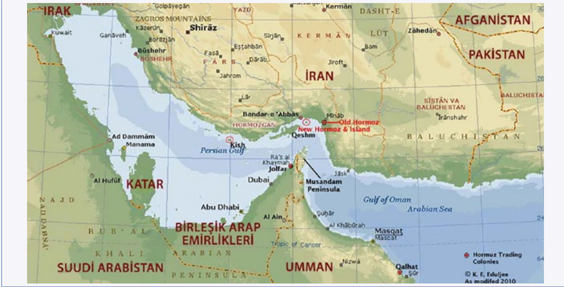
HARİTA 3: BASRA KÖRFEZİ