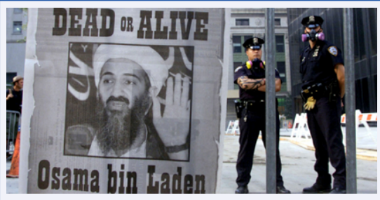
GÖRSEL 6. NEW YORK POLİSİ, USAME BİN LADİN ARANIYOR YAZILI PANKARTIN YANINDA, 2001, NEW YORK, ABD 18

gerçeklik mitini üretmektedir. Suriye ordusuna eklenmiş el-Manar muhabirleri, izleyicinin sahadaki gözü olma iddiasıyla Suriye ordusunun sahadaki mücadelesini gözler önüne sermede şeffaf davrandığı mitini inşa etmektedir. Bu “şeffaflık miti” Suriye ordusu ve Hizbullah’ın davasının haklılığına göndermede bulunmaktadır. Haberlerde inşa edilen diğer bir mit, düşmanın niteliğine ilişkindir. “Kötü” olan düşmanın kimliği şu göstergeler yoluyla inşa edilmektedir: Suriye halkına zarar veren, yabancı milletlerden ve şeytani. İlk iki gösterge “kötü” düşman imgesini insani özelliklerle tarif ederken, en vurucu gösterge olan “şeytan” imgesi insan dışı bir özellik atfetmektedir. Tıpkı İran resmi söylemi tarafından İslam dünyasında tüm felaketlerin sorumlusu olarak görülen ABD’nin “tüm kötülüklerin anası” ve “büyük şeytan” olarak tanımlaması gibi, “yabancı asıllı” düşmanlar şeytan olarak tanımlanmaktadır. Şeytanın, insani özelliklerden farklı olarak iyi olması mümkün olmadığı için onu değiştirmek imkansızdır, bu yüzden tek çözüm yolu onu yok etmektir. Haberlerde şiddet dili yoluyla inşa edilen mit, şeytanı yok etmek için Hizbullah taraftarlarının savaşa destek vermesidir. Bu mit aynı zamanda diğer haberlerde olduğu gibi Hizbullah’ın Suriye’deki varlığını ve kullandığı şiddet araçlarını meşrulaştıran bir söylem inşa etmektedir.